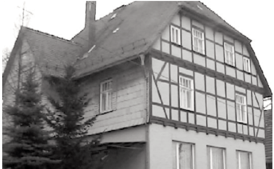
Das Schullandheim in Tonndorf.

ein wichtiger Bestandteil unserer Bildungslandschaft. Daher setzt sich die CDU Fraktion auch in der Zukunft für den Erhalt der Einrichtung ein."