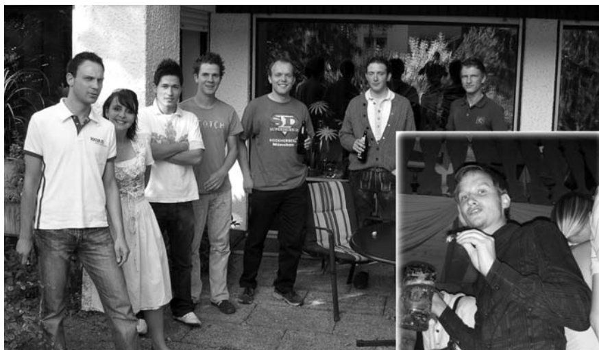
Gute Stimmung in München.

sodass wir zwar vollen Magens aber dennoch schweren Herzens die Rückreise ins Weimarer Land antraten. Die Trennung währte jedoch nicht lange (siehe Titelseite).