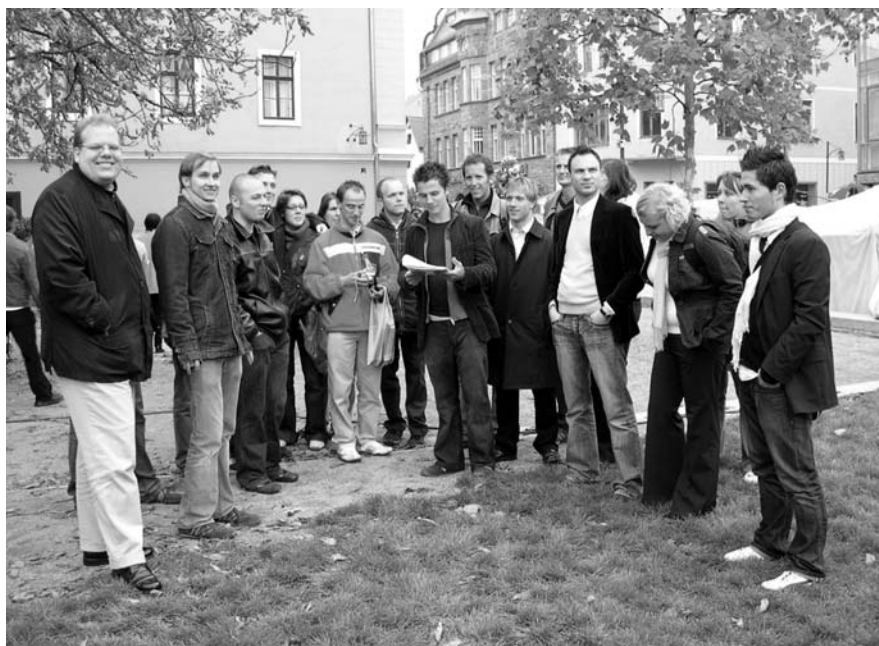
Viel Goethe und Schiller bei der Stadtführung in Weimar.

JU Sommerfest Südkreis feiert in Blankenhain.....Seite 2 CDU Fraktion Schullandheim Tonnendorf..... Seite 3 JU Partnerkreisverband Treffen mit JU KV München-West.....Seite 4